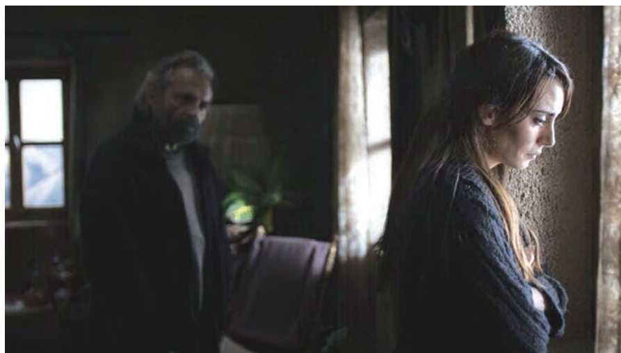
WINTER SLEEP (2014) de Nuri Bilge Ceylan