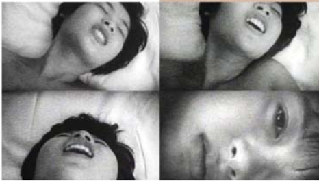
EXTREME PRIVATE EROS KAZUO HARA