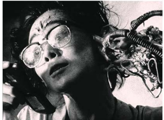
TETSUO SHINYA TSUKAMOTO