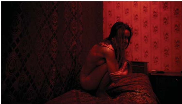
ATLAS ANTOINE D'AGATA