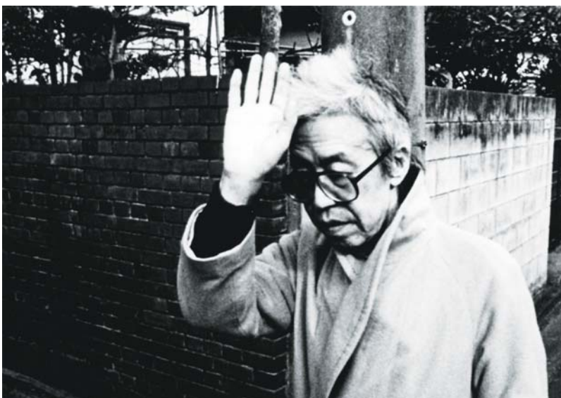
THE EMPEROR'S NAKED ARMY MARCHES ON (1987) et A DEDICATED LIFE (1994)