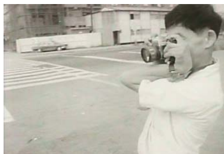
GOODBYE CP (1972)

« Dans mes documentaires, j'essaie de générer de profondes émotions chez le spectateur, de le stimuler [...]. Je pense que j'y parviens à travers mon utilisation des corps. J'aimerais que les spectateurs dans la salle ressentent physiquement des douleurs et des démangeaisons qui les inciteraient à agir après avoir vu mes films. J'aimerais capturer leurs corps de cette façon. »