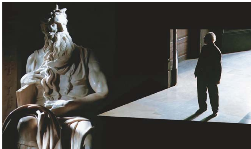
LE REGARD DE MICHEL-ANGE (2004)