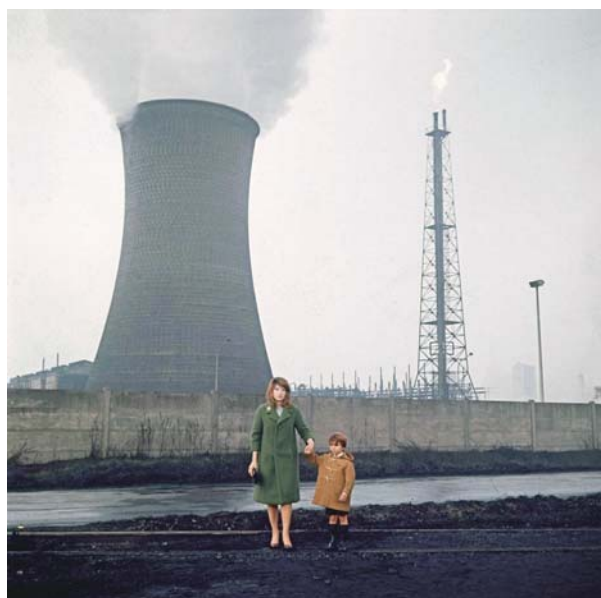
LE DÉSERT ROUGE (1964)