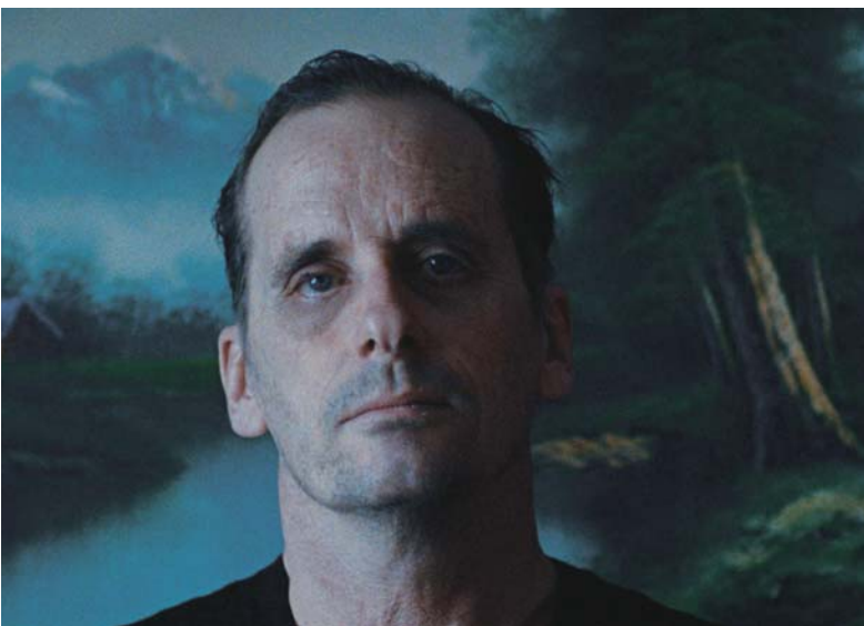
FULL LOVE (2013)

Je pense que je suis resté attaché à cette idée de quête. Surtout lorsqu'elle est traduite par quelque chose d'intime, par la douceur. Ce goût me vient très certainement de l'enfance. Et je n'ai jamais cessé de le cultiver. Je pense à la linéarité pourtant banale de mes premiers grands coups de cœur cinématographiques. Le film Commando (de Mark L. Lester) par exemple que, très jeune, je m'étais appliqué à « novelliser ». Il est de ce cinéma qui, par une candeur qui relève de la fable, appartient davantage à la mythologie. Ainsi, j'étais enfant et, par la grâce de ma naïveté peut-être, je me voyais prendre le relais d'une expression artistique que je jugeais valable et nécessaire. C'est encore, je pense, ce que je poursuis aujourd'hui, seulement avec une plus grande lucidité et un sérieux qui gâte parfois le plaisir que je prenais autrefois à me faire raconter des histoires. Commando est un film qui m'a longtemps fasciné par son énergie brute et sa violence trop exagérée pour n'être que divertissante. Il devient, avec le temps, un film qui a arpenté l'imaginaire, qui a cerné l'enfant en moi, et sûrement plusieurs de ma génération. Comme Nouvelles, nouvelles , c'est peut-être un film de Noël qui s'ignore. Il en a toute la générosité en tout cas. 24