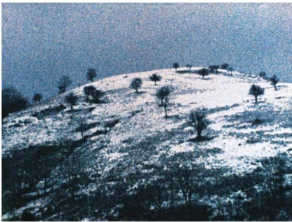
AUTREMENT, LA MOLUSSIE de Nicolas Rey