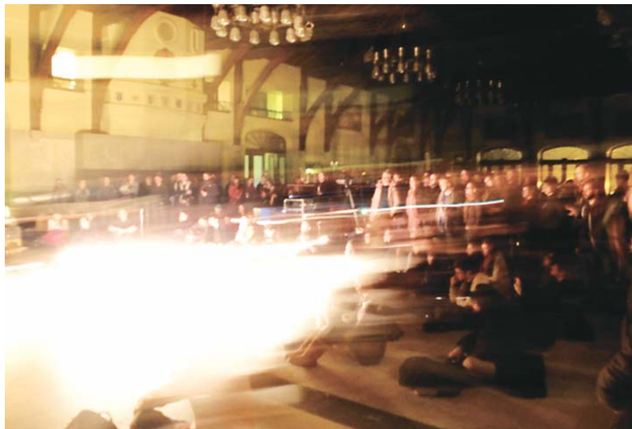
Metal Machine Cinéma, Montréal, janvier 2012. Présentation de l'Institut pour la coordination et la propagation des cinémas exploratoires.