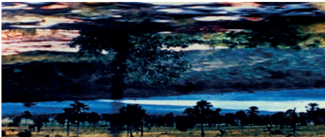
Engram of Returning

Contrairement à All That Rises , Trees of Syntaxes , Leaves of Axis pour lequel il n'y avait qu'un seul lieu de tournage, dans Engram... on a un autre rapport à l'espace. Bien qu'il n'y ait que des plans de paysages, ce que j'essayais de produire avant tout, c'est un lieu imaginaire, vraiment lié à la mémoire, et plus spécifiquement à mon propre imaginaire. L'idée était de créer un état métaphysique, émotionnel, à partir d'images concrètes. De retracer des souvenirs, des moments de ma vie pour lesquels je n'avais pas d'images filmées. D'évoquer une époque à laquelle