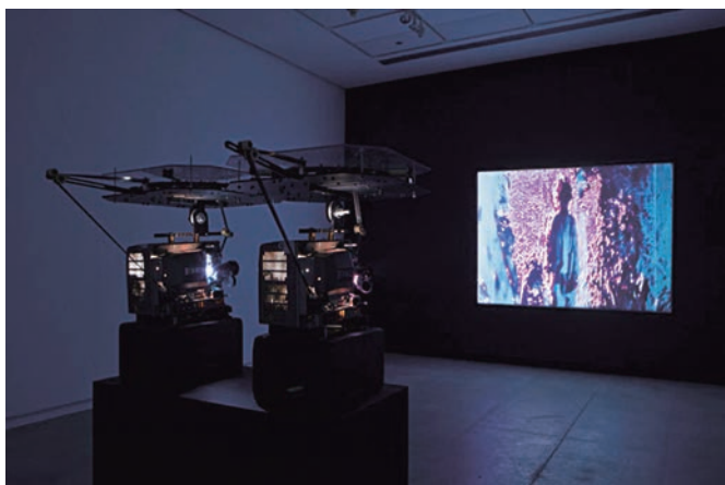
Never A Foot Too Far présenté au Liaison of Independent Filmamakers of Toronto, 2013

Oui, j'ai le désir d'en faire d'autres. Mes derniers films se sont orientés de manière à ce que je travaille avec des musiciens, mais quand je fais les images, l'approche est toujours la même. Quand je structure mes films, j'essaie toujours de les construire comme des pièces musicales. Je fais toujours en sorte de créer une structure visuelle très forte qui se tient sans son, de créer au montage une musicalité propre à l'image.