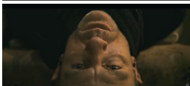
The Girl with the Dragon Tattoo (2011)

s'intensifie, ces images d'une certaine innocence américaine perdue font place aux scènes de bombardements.