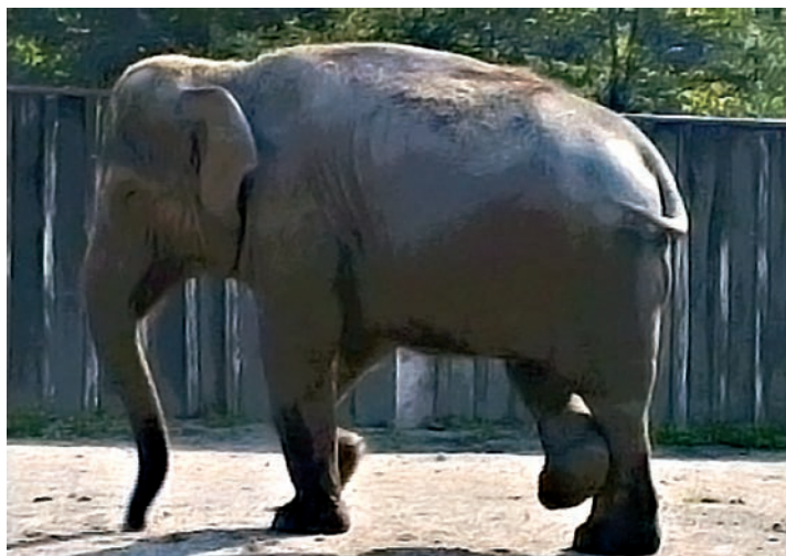
Slon, Tango (1993) Chris Marker

Par-delà les frontières / Les prairies et la mer / Dans les grandes noirceurs / Sous le feu des chasseurs / Dans les mains de la mort / Il s'envole encore... , premier couplet du Cœur est un oiseau de Richard Desjardins. Belle métaphore de la force agissante des images qui s'extrait des mortifères prises de vue pour aller toujours plus haut, plus haut , là où le silence des humains malades de la communication tous azimuts rejoint la musique des sphères. 24