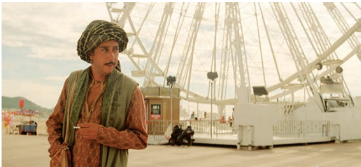
Les Mille et une nuits (2015)