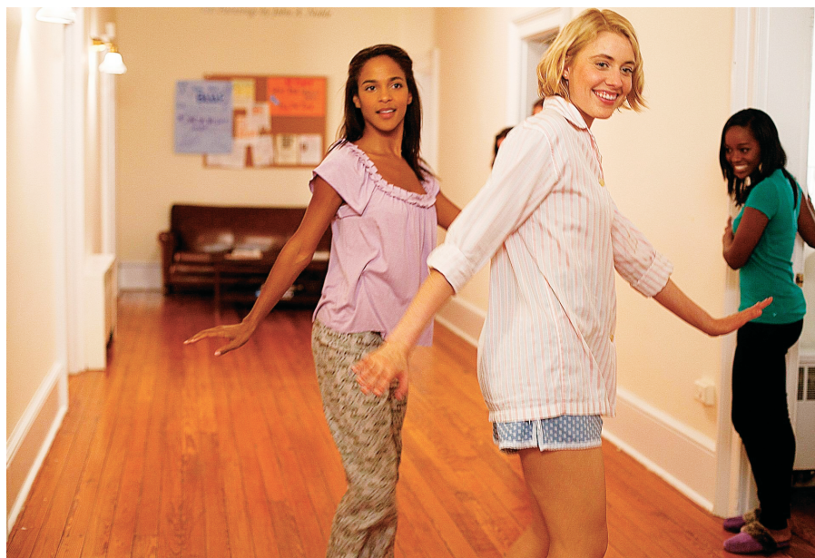
Damsels in Distress (2011)

Dans Damsels in Distress , Violet (Greta Gerwig) désire populariser une nouvelle danse qu'elle surnomme la « Sambola » : le film se termine d'ailleurs sur un clip dans lequel la jeune femme nous explique pas à pas comment danser celle-ci. Lorsqu'un professeur lui demande pourquoi elle désire tant inventer une nouvelle danse populaire (et, incidemment, pourquoi ses héros sont Richard Strauss, Roderick Charleston et Chubby Checker), Violet répond avec conviction : « Dance crazes enhance and elevate the human experience, bringing together millions of people in a joyous celebration of our God-given faculties and passing these delightful modes of physical expression down through the generations. 1 »