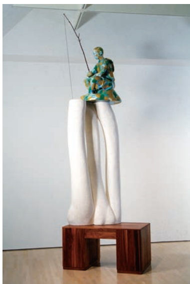
La forêt (1995)

J'ai emprunté au cinéma l'effet du merveilleux gros plan, des changements d'échelle, de la discontinuité, du découpage et du