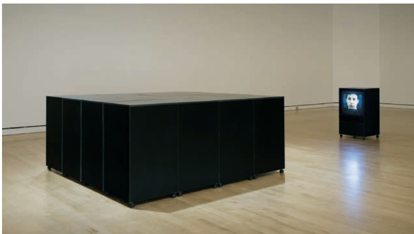
Le bruit des yeux , installation vidéo (1996) © Bertrand R. Pitt

Présenté pour la première fois à Occurrence (Montréal) en 1996, et aujourd'hui au MNBAQ, Le bruit des yeux est une de mes premières installations vidéo. Cette œuvre est représentative de mes préoccupations au sortir de l'université. Il m'importait alors d'interroger le dispositif télévisuel, son omniprésence, son flot continu d'images, comme notre avidité à consommer et à nous projeter dans ce miroir mouvant.