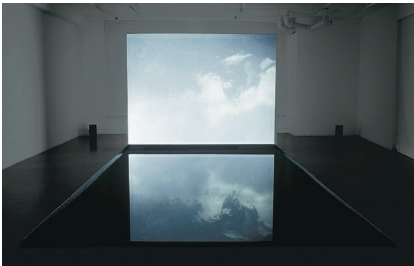
Dérive , installation vidéo (2002) © Bertrand R. Pitt – Vidéo: https://www.youtube.com/watch?v=G74YQTLKzIY

Avec la popularisation des projecteurs vidéo au tournant des années 2000, l'occupation totale du lieu d'exposition par l'image devenait possible à un coût raisonnable. J'explorais diverses stratégies scénographiques: réflexion, inversion, détournement des images et des sons. Libéré du rapport à la télévision et soucieux de notre rapport à la nature et au paysage, je me rapprochais davantage d'un dispositif « cinématographique », le lieu d'exposition étant éclairé seulement par la lumière du projecteur, à la différence qu'ici j'invitais le spectateur à parcourir l'espace, créant ainsi sa propre interprétation de l'œuvre.