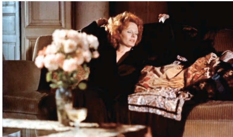
India Song de Marguerite Duras (1975)