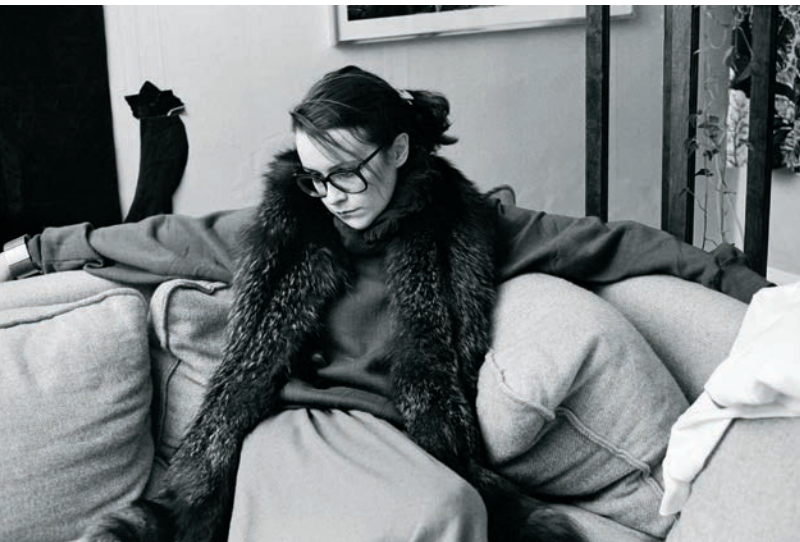
Autoportrait aux renards (1979) – extrait de Mon regard est net comme un tournesol (2011)