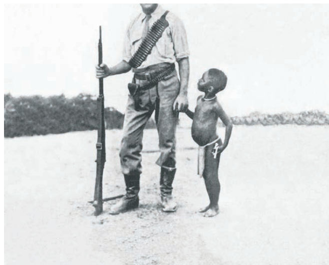
Élément de Inner Sanctum (1995), Collection MNBAQ

Dans les années 1970 et 1980, il y avait encore plusieurs salles de cinéma à Montréal qui présentaient des films d'auteur des quatre coins du monde. J'ai eu plusieurs coups de cœur au cinéma Élysée : Ettore Scola, Tati, Kieslowski. J'ai vu mon premier Woody Allen au Cinéma 5 et Tarkovski au Cinéma Parallèle. J'ai eu la chance de voir It's A Wonderful Life de Capra à la Cinémathèque française à Paris, Harvey de Henry Koster au cinéma Regency à New York, Sherlock Jr de Buster Keaton au Silent Movie Theater à Los Angeles qui, par miracle, existe toujours. Visionner ces films dans de tels lieux, en copie très souvent impeccable, rendait l'expérience encore plus magique, comme un moment figé dans le temps.