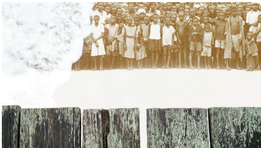
Blancs de mémoire (2013), vidéo, Galerie Antoine Ertaskiran

D 'aussi loin que je me souviens, le cinéma a toujours fait partie de ma vie. Le premier film que j'ai vu en salle, The Sound of Music , m'avait complètement ébloui. C'était en 1965, au cinéma Crémazie, j'avais 8 ans.