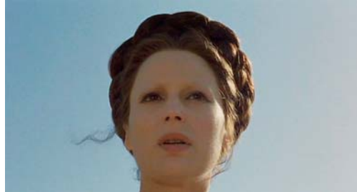
Porcherie, Théorème et Édipe Roi

à l'heure. Pour moi le théâtre, c'est tellement l'artifice, et c'est l'artifice aussi dans la manière dont la représentation théâtrale a lieu, dans ce truc incroyable où il y a des gens dans la salle et des gens sur le plateau; cela crée quelque chose d'unique. Ce qui me fascine aussi, c'est la façon dont les spectateurs entrent dans une salle. Au cinéma, il y a une première séance à 14h, une autre à 16h et une autre à 18h. Le siège sur lequel on s'assied sera foulé par 4 ou 5 personnes dans la même journée, alors qu'au théâtre, on sait que ce siège-là, il nous appartient pour la journée, voire pour l'éternité. Et puis, il y a cette question de la chose qui n'est pas reproductible. Le plaisir et le bonheur de l'acteur de théâtre, c'est qu'il sait qu'il peut chuter à n'importe quel moment, alors qu'au cinéma, il sait qu'il peut faire et refaire la prise. Et il y a aussi la responsabilité de l'acteur : une fois qu'il est en scène, l'acteur est totalement responsable de ce qu'il est en train de faire alors que l'acteur au cinéma livre quelque chose qui pourrait être complètement effacé, déplacé par le metteur en scène au montage.