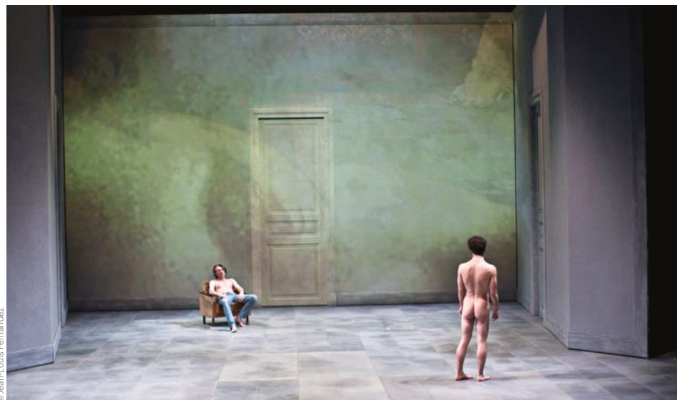
Erich von Stroheim, d'après un texte de Christophe Pellet, Théâtre du Rond-Point, Paris, 2017