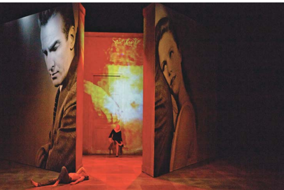
Erich von Stroheim, créé au Théâtre national de Strasbourg et repris au Théâtre du Rond-Point, 2017 Photo tirée du film Le fleuve sauvage d'Elia Kazan

sa propre création. Je crois que, moi aussi, j'essaie de trouver une place de cet ordre-là, c'est-à-dire me nourrir absolument de tout ce qui m'entoure sans être pour autant un imitateur qui reproduirait un geste qu'il a admiré.