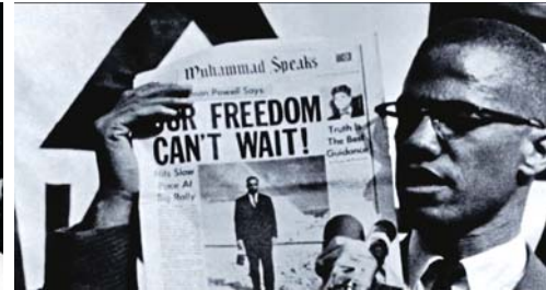
I Am Not Your Negro