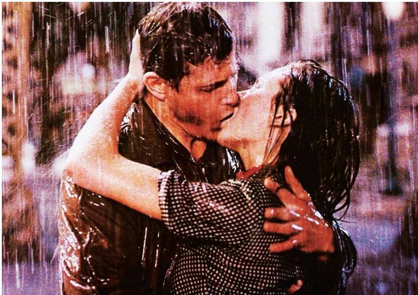
Streets of Fire de Walter Hill (1984)

Contre toute attente et au-delà d'apparences bien trompeuses (Rambo, Conan et ces cohortes de héros machistes), revisiter le cinéma populaire des années 1980, c'est bel et bien plonger dans un monde où les émotions prévalent, où la sensibilité se revendique à fleur de peau. C'est aussi retourner vers l'enfance. Pas juste pour la masse des films alors produits pour un public spécifique, mais aussi pour cette étonnante absence d'inhibition sentimentale qui caractérise grand nombre de productions de cette période et qui ne peut probablement s'observer qu'a posteriori en opposition à d'autres époques. C'est renouer avec un cinéma où l'on pleure pour un rien. Où l'on s'étonne de rire bêtement. Parce que l'amour est beau. Parce que la vie est triste. Parce que l'amitié entre un petit garçon et un extraterrestre d'apparence fécale réussit bel et bien à être plus fort que tout ( E.T. , Steven Spielberg, 1982). On est à l'époque d'un brutal retour