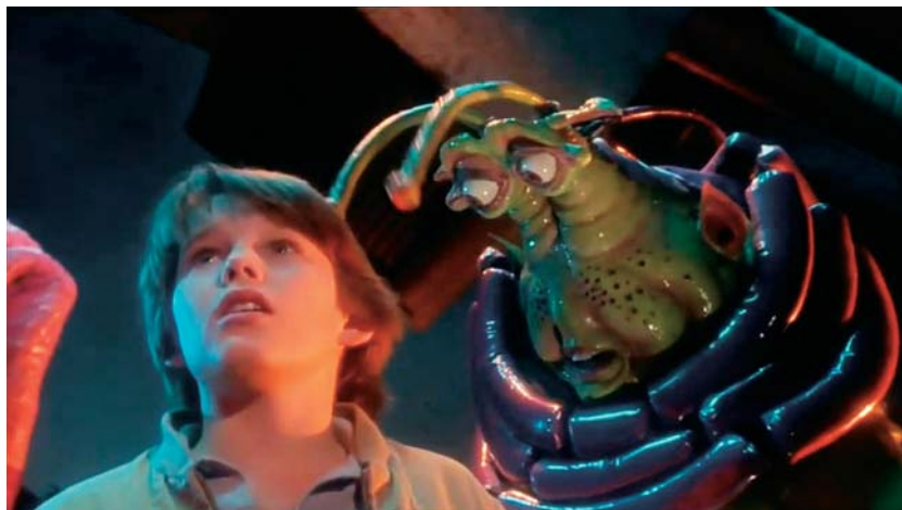
Explorers de Joe Dante (1985)

De 1969 à 1972, « on a marché sur la Lune ». À la fin des années 1970 et surtout dans les années 1980, l'aventure spatiale bat son plein : satellites, sondes ou stations spatiales sont lancés en grand nombre. Les sondes Voyager 1 et Voyager 2 explorent pour la première fois le système solaire, obligeant à reconsidérer tout ce que l'on croyait savoir jusque-là et à réécrire les manuels d'astronomie. Le cinéma témoigne de cet enthousiasme collectif pour les découvertes astronomiques : les sujets dont s'empare la science-fiction témoignent de cet engouement, tout en exploitant ces thématiques de façon ludique et fantastique. Outre les séries de films lucratives comme les Alien , Star Wars et autres Star Trek (initiées au cinéma à la fin des années 1970, développées dans les années 1980), on compte nombre de films « mineurs » mais habités par cette frénésie de l'espace : à titre d'exemples incongrus, le vétéran Stanley Donen s'attelle à la science-fiction avec Saturn 3 (1980), et le célèbre 2001 de Kubrick se voit attribuer une suite, 2010 (Peter Hyams, 1984). D'autres films s'adressent à un public très jeune, comme The Black Hole (« le trou noir », de la compagnie Disney en 1979) ou Explorers (Joe