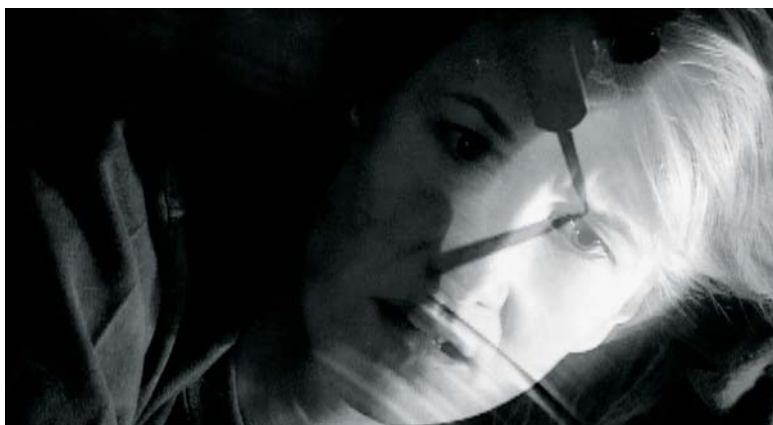
Twin Peaks et Inland Empire