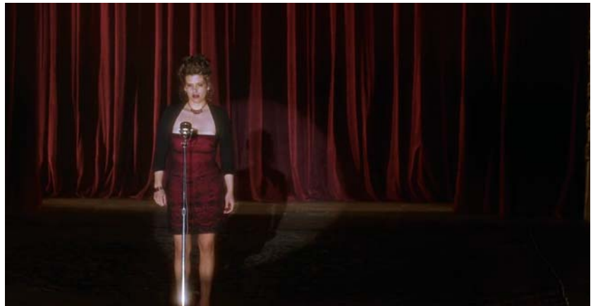
Mulholland Drive (2001)

de transmission du son. Mulholland Drive (2001) en offre l'exemple le plus évident dans la scène où le magicien du Club Silencio (Richard Green) nous instruit sur la nature illusoire du son en direct, et où Rebekah Del Rio illustre avec force ses propos en s'évanouissant en plein milieu d'une incroyable interprétation en espagnol de « Crying », la chanson de Roy Orbison. Le son de sa voix continue de résonner alors qu'on la sort de scène, inconsciente. Témoin de cet incident, Betty (Naomi Watts) est prise de convulsions, ce qui laisse présager la reconfiguration dramatique du récit dans le dernier acte du film. C'est alors comme si l'illusion créée par le chant en play-back était d'une telle force que, lorsque la mécanique en est déconstruite, le tissu même de l'espace, du temps et de l'identité se désagrègeait.