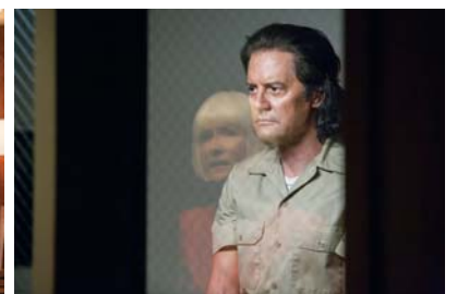
[1] The Straight Story et [2-3] Twin Peaks: The Return