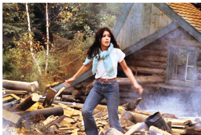
Capture d'écran : Willie Lamothe – Ok... Caméra de Michael Rubbo (1973) et La mort d'un bûcheron de Gilles Carle (1972)