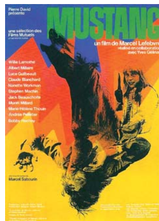
Affiche de Mustang