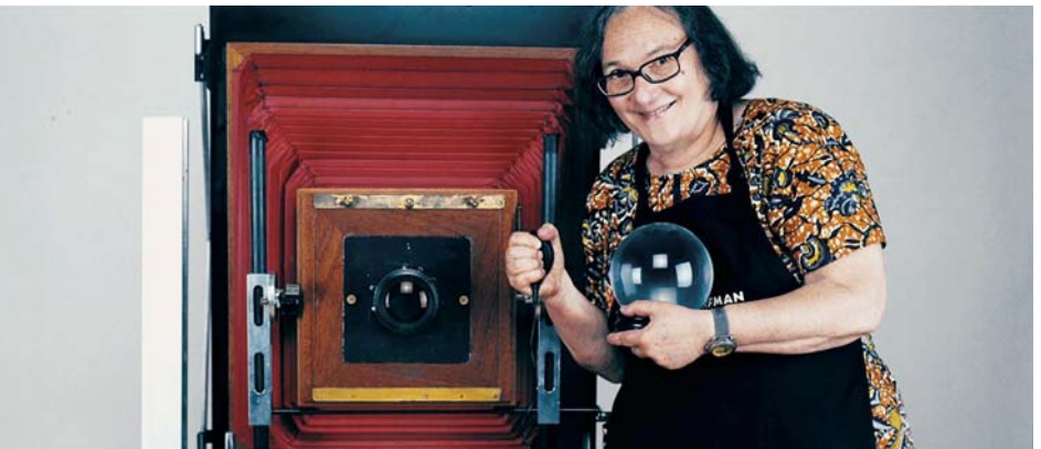
↑ The B-Side : Elsa Dorfman's Portrait Photography (2017) ← The Thin Blue Line (1988)