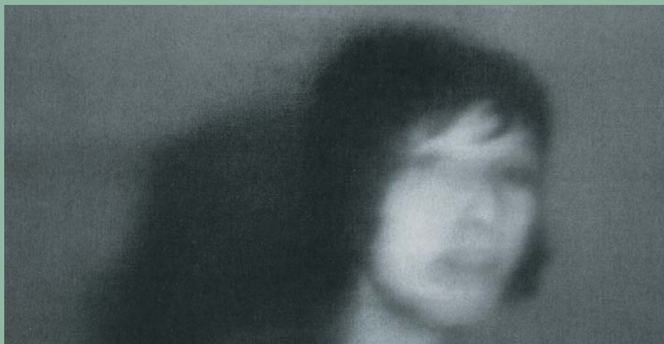
↑ Photographie de Ulrike Meinhof par Gerhard Richter (1988)