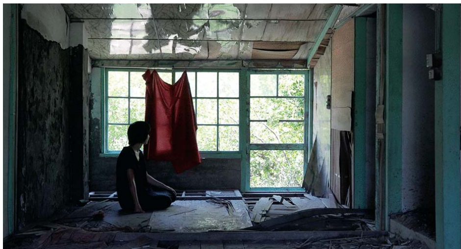
↑ Letter #69 de Hsin-i-Lin (2016) → → I Have Sinned a Rapturous Sin de Maryam Tafakory (2018)