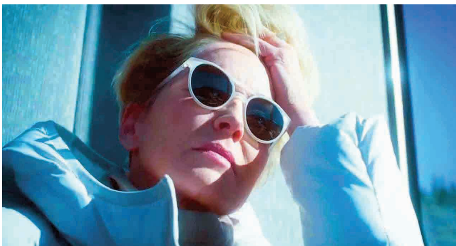
↑ Mosaic de Steven Soderbergh (2018)