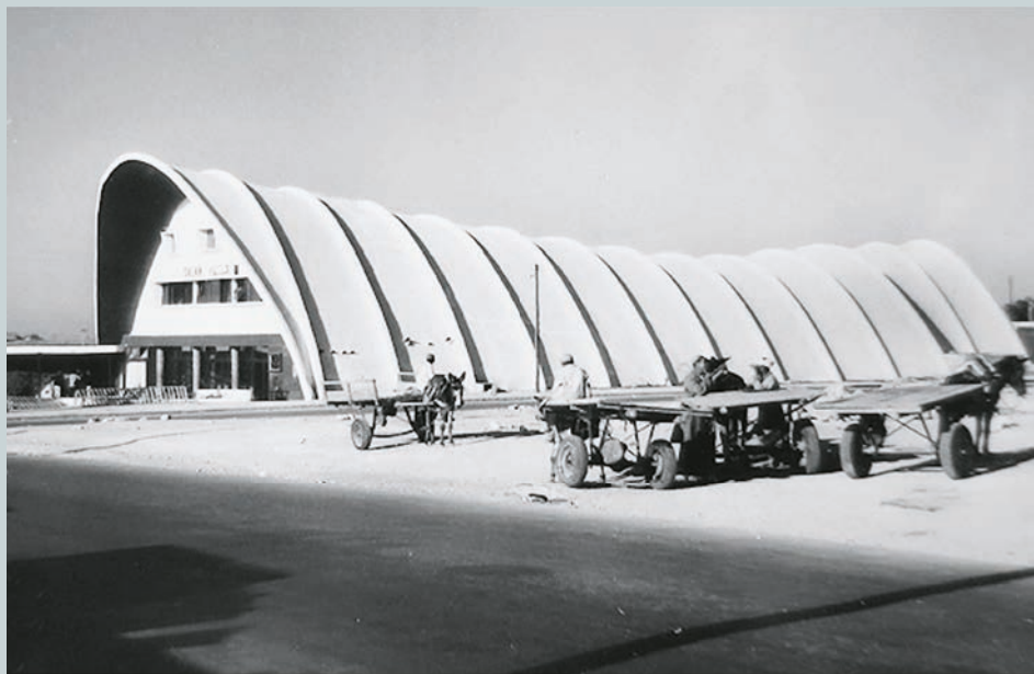
↑ Cinéma Salem, Agadir, Maroc