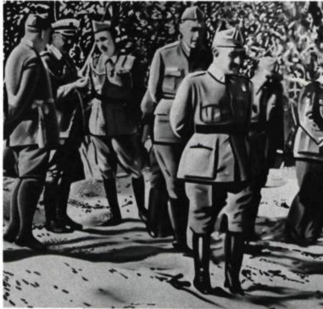
«Le général Franco avec son état major, au printemps 1937». Série «cadre historique» de Equipo Realidad, Valence.

30 juin 1984, Madrid, 10 heures, en face d'un café «con leche». (...) Je crois que depuis quelques années l'Espagne, particulièrement Barcelone et Madrid, est sortie de l'underground et veut se placer «sur la carte», comme Paris, Berlin, New York ou Londres. C'est le post-modernisme qui est roi. Musique, graphisme, peinture, etc. Je ressens chez les Espagnols un désir de se mettre à la page par la voie officielle du marché avec un grand M. coûte que coûte. L'entrée de ce pays dans le Marché Commun en est une preuve évidente. Il y a ici de très bons peintres qui valent bien des Salomés ou plein