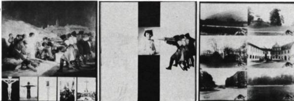
«Tres esquemas de mort artificial». Fina Miralles (1977)

importation de magazines, etc. La libération. M.R. me racontait que l'Espagne était l'an dernier le plus gros acheteur d'armes auprès des États-Unis.