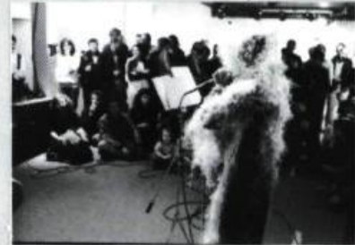
L'ABOMINABLE HOMME DES LETTRES Lecture instrumentale.