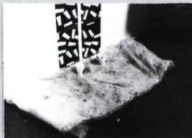
Jürgen O. Olbrich Réparation no 2044