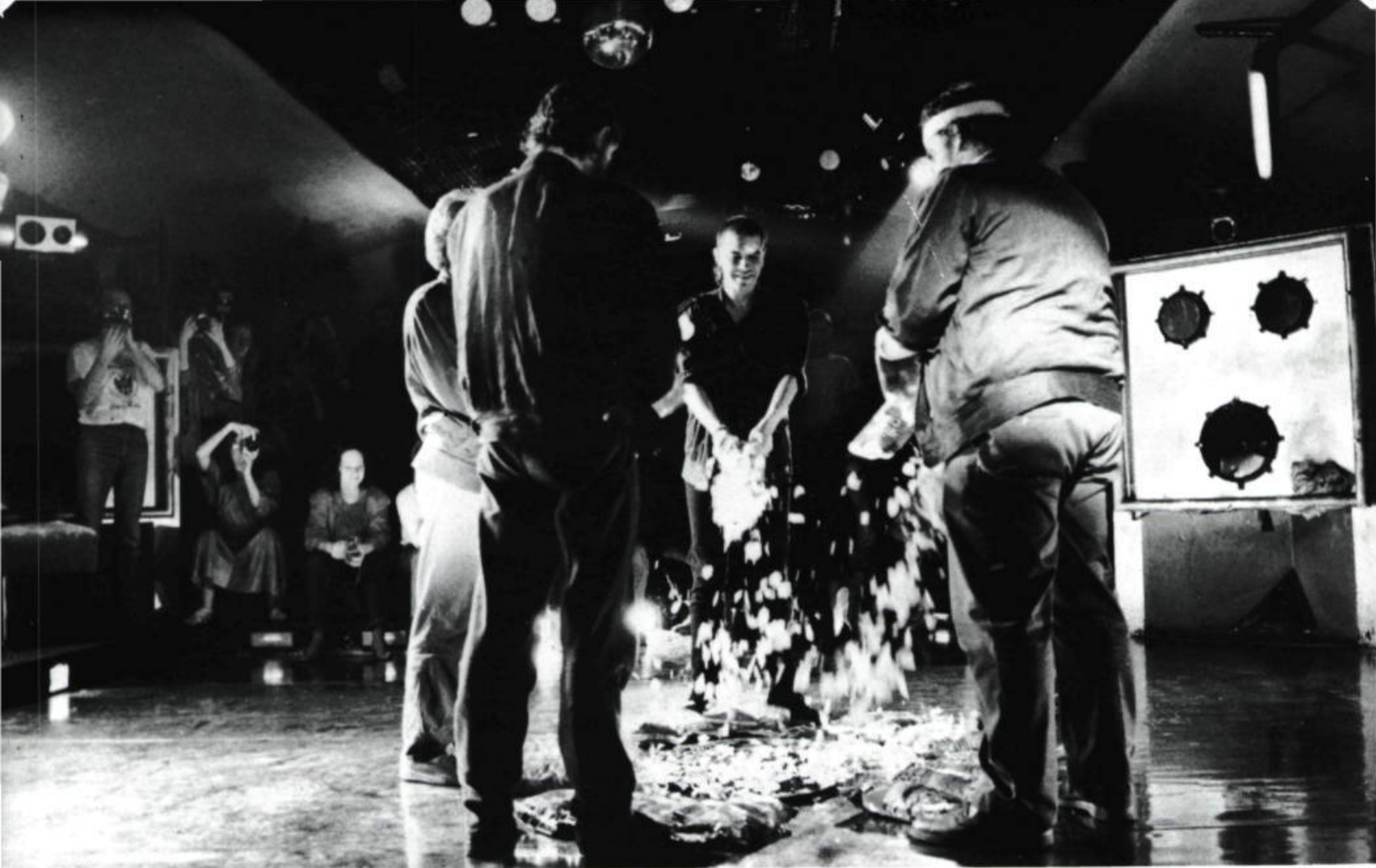
Action croustilles », dans la discothèque du New York, éclatement de sacs de chips et distribution sur plateau d'argent. Photo: Yves Graubner

Portes d'auto et miroir: Grant Poier, Anne Noel, Jürgen O. Olbrich. Photo: Yves Graubner