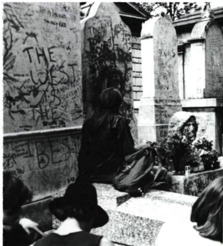
Tombe de Jim Morrison au Père Lachaise.

* Citations tirées de Lords and the New Creatures , trad. par Yves Buin et Richelle Dassin, et de An American Prayer , trad. par Hervé Muller.