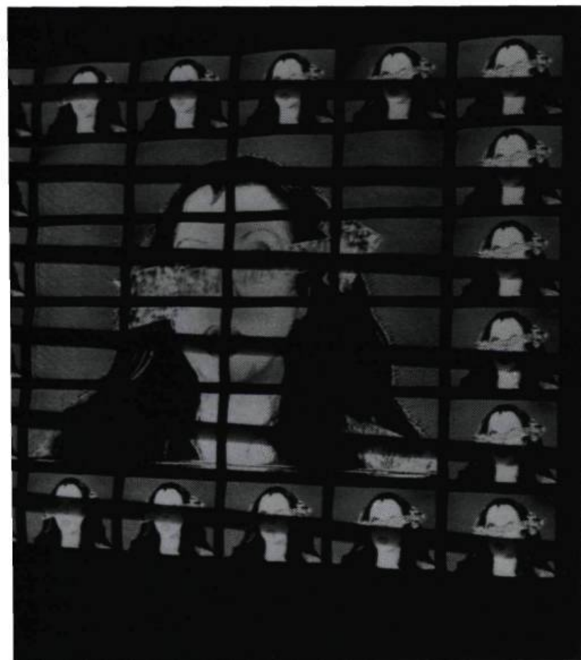
« Mise en scène pour un grand FIAT », vidéo sur multiécrans dispatché par ordinateur. Installation au Forum des Arts et Univers scientifique et technique de Toulouse, oct. 86.

tasme du « faux semblant », du trompe l'œil, de l'artificialité outrée. Cette esthétique la conduit à se référer à l'art baroque combiné à « un high-tech look from area of electric joy ».(5)