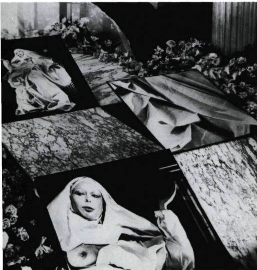
Installation multimedia laser-vidéo-photo. « Mise en scène pour une Sainte », espace lyonnais d'art contemporain, expo made in France, 1981.