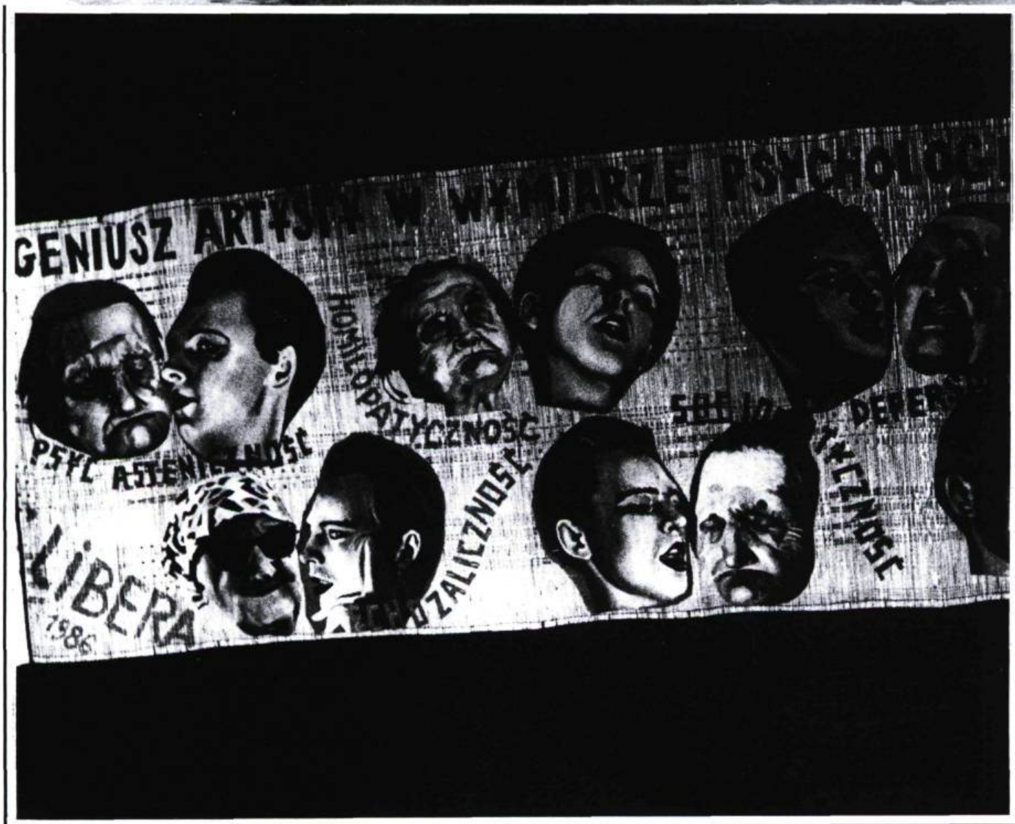
PAWEŁ CHEKMECKI, GALERIA STODOLA, PAINTING AND INSTALLATION (1987) • ZBYSZEK LIBERA, INSTALLATION TAKE POSITION (1988)