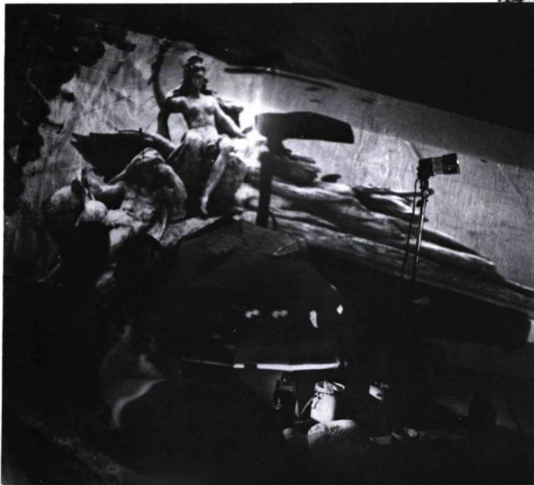
Gilles MAURY , france