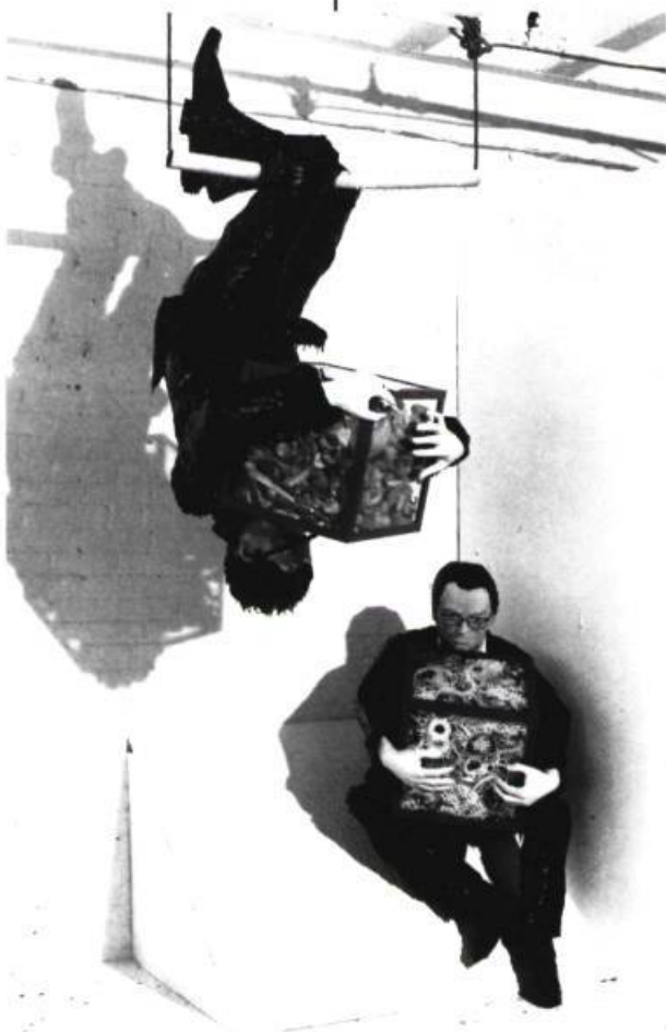
Paul GRÉGOIRE, détail de l'environnement non achevé Non.non.non , 1988. Fibre de verre et matériaux divers, grandeur nature.