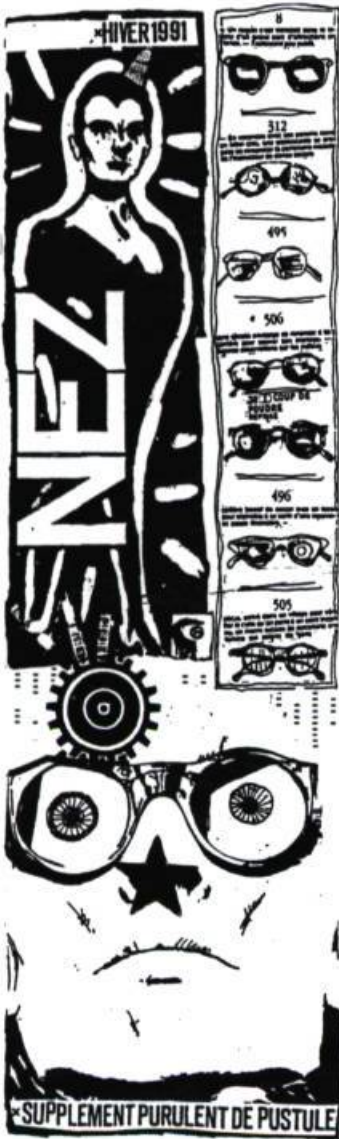
PUSTULE SUPPLEMENT PURULENT DE PUSTULE