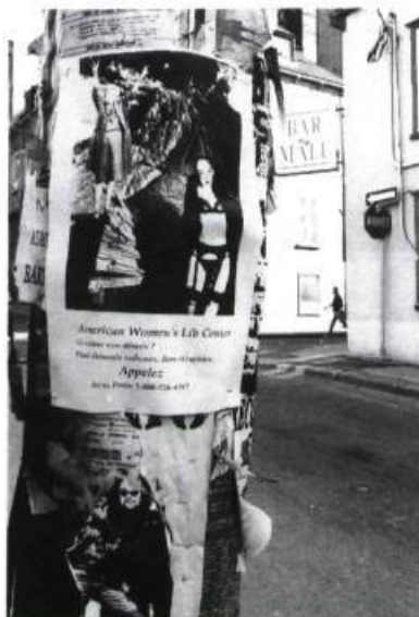
Collage : YT, Photo : Jocelyn SAINT-PIERRE

2 Billes en vente au guichet du Colisée.