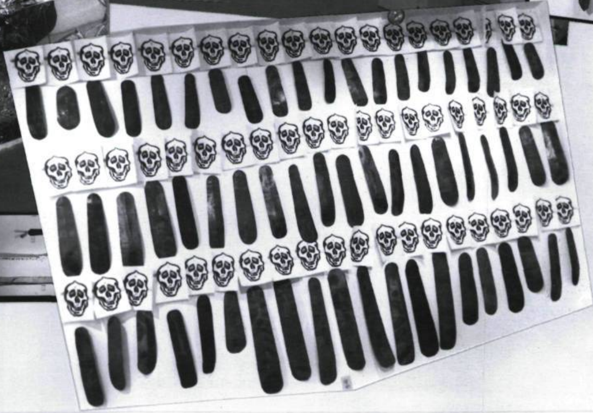
Photomontage de François BERGERON