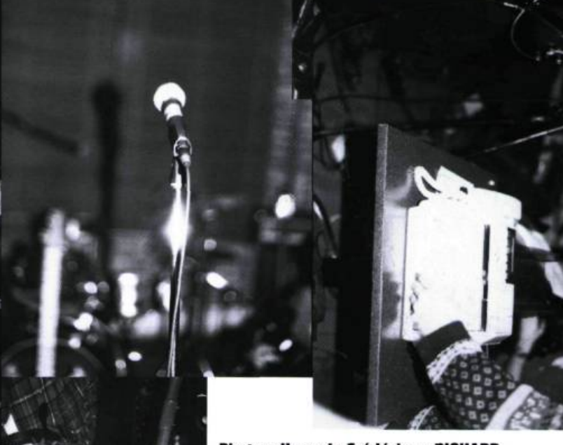
Photocollage de Frédérique RICHARD

La venue d'Alain GIBERTIE a été rendue possible grâce à la collaboration du programme d'artistes étrangers du Conseil des Arts du Canada.