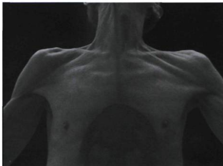
Alain PELLETIER, tiré de la bande Faust Médusé , 1995

Ayant cheminé dans cette étrange ambivalence et posant la dernière image, le vidéaste s'exclamera peut-être : c'était donc ça ! Le processus aura peut-être l'allure d'une machine célibataire autour de laquelle il tournait. La vidéo lui apparaîtra peut-être comme une unité en torsion lui lançant les signaux d'une identité nouvelle et momentanée. Une identité qui, comme l'Objet de l'espace virtuel, est essentiellement sans consistance et non localisable. ■