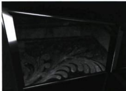
version 3 • X-Teresa, ancienne cathédrale du 18e siècle, Mexico, Mexique, exposition Des Promenades, novembre 1997, en collaboration avec OPERA