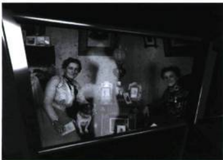
version 1 • Rues Amherst/Ontario, Montréal, Québec août 1996, en collaboration avec le GIV

Images et texte Gisèle Trudel à l'invitation de Philippe Côté