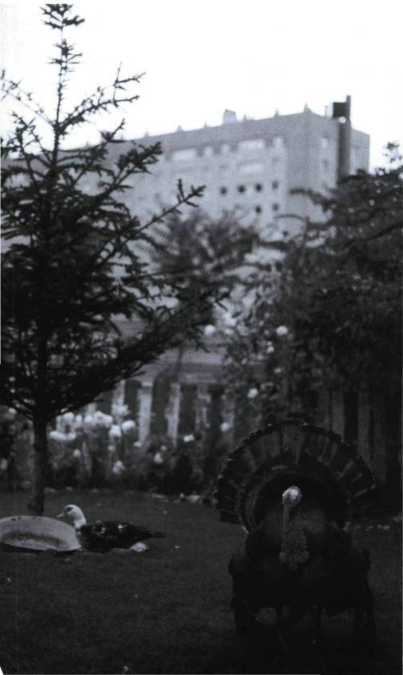
Illustration : Julie BOUILLET

Son Favela théâtre, où il ne travaille qu'avec des acteurs non-professionnels ou plutôt étrangers aux scènes officielles, propose une proximité, une ferveur disparue ; pour Le Rêve d'un homme ridicule de DOSTOÏEVSKI, avec lequel il l'inaugura, les spectateurs se serraient les uns contre les autres autour de la grande cheminée ; lorsqu'il nous