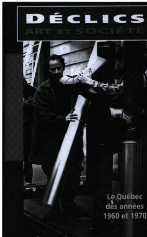
Le Québec des années 1960 et 1970

En y réfléchissant, je trouve que ce type de publication avec photo couleur et graphisme institutionnel est un reflet, au sens non-léniniste, du mobile de la pensée. Et les œu-