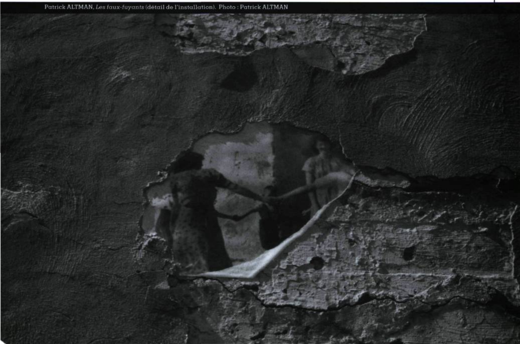
Patrick ALTMAN, Les faux-fuyants (détail de l'installation).

Cinq artistes à la Maison Gomin aura donc été l'occasion d'assister à la création de cinq œuvres intimistes. Dans l'insondable architecture, l'événement aura évité l'envahissement ostentatoire. L'intime, l'identité et le territoire individuels, la violence du temps imposé, auront constitué les grands axes de cette exploration. En marge du sensationnalisme et de l'anecdote.