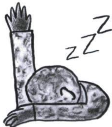
On peut contacter Asiatopia et Chumpon APISUK à

Concret House 57/60 Tivanond Road Nonthaburi, 11000 Thaïlande