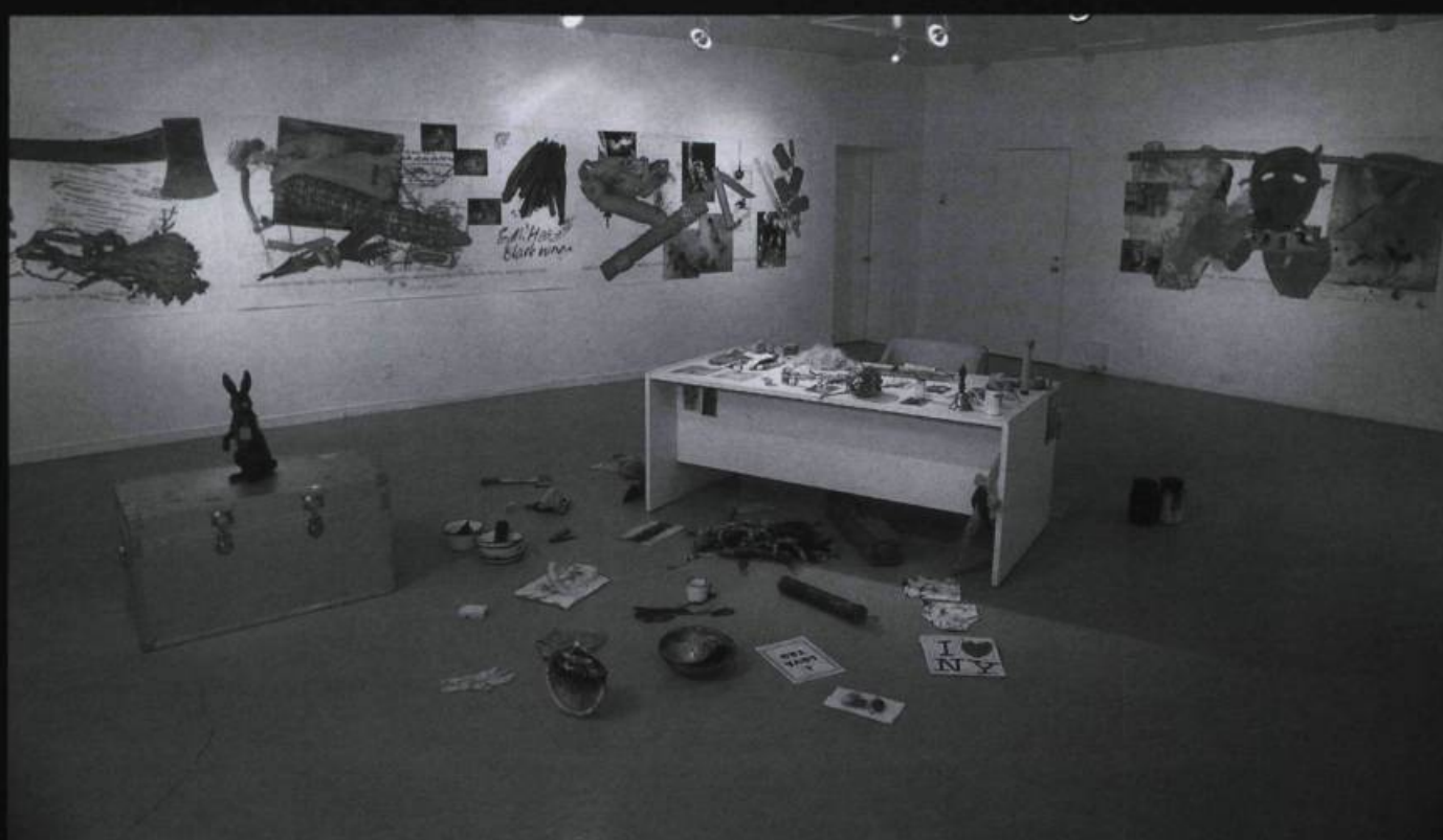
Vues de l'action et de l'exposition.