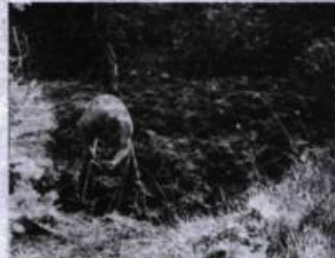
LIBERATION, 14 novembre 1978