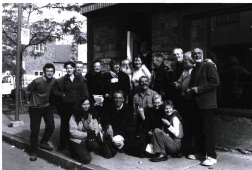
> Art action 1958-1998, 1998.