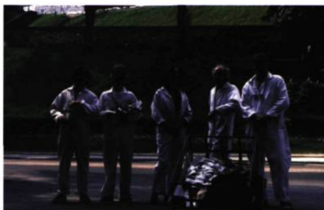
> Collectif Inter/Le Lieu, Manœuvre nomade , 1994.