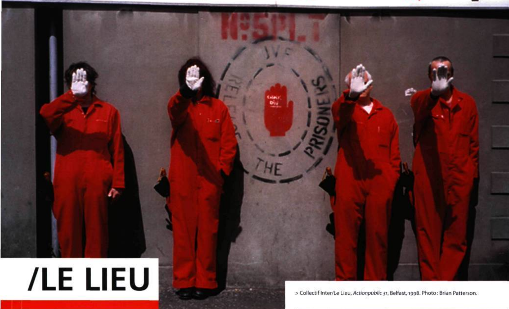
> Collectif Inter/Le Lieu, Actionpublic 31 , Belfast, 1998.