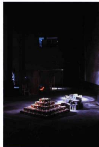
> Ex Teresa Arte Actual.

Latinos del Norte proposait un ensemble complet d'activités. Des critiques mexicains ont couvert les diverses activités dans le numéro 79 de la revue Inter, art actuel . Une présence de 21 artistes mexicains à Québec, en septembre 2002, allait clôturer cet échange entre les villes de Québec et de Mexico. Un numéro spécial d' Inter, art actuel (82), en français et en espagnol, témoigne de la situation artistique de Mexico.