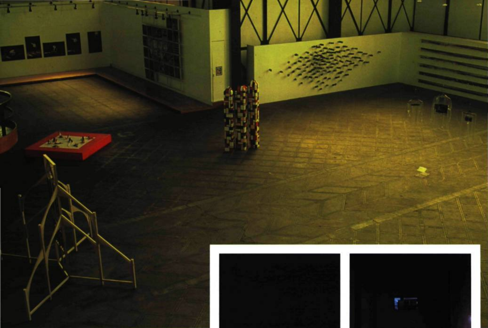
> Museo Universitario del Chopo.