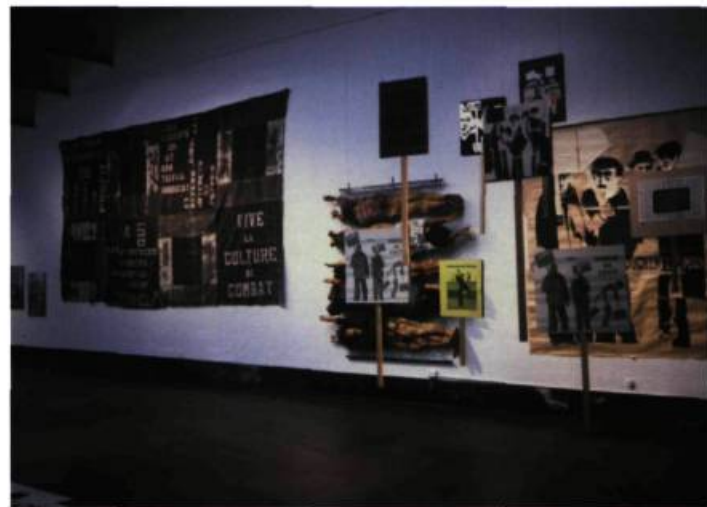
> Exposition collective Pratiques sociales et engagées en art au Québec, 1975-1980, Musée du Québec, 1981.

Une publication de 120 pages sera produite, tandis que la revue Intervention , n° 14, relatera l'essentiel de cet événement abordant plusieurs directions en 1982.