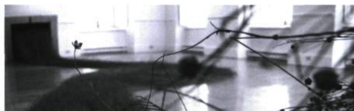
> Louise Lemieux Bérubé, Aimez-vous les uns les autres , Le lin : chroniques et récits , 2007. Photo : Louise Lemieux Bérubé.

En entrant dans ce lieu de culte toujours vivant, on voit alors les bannières de Louise Lemieux Bérubé, une œuvre intitulée Aimez-vous les uns les autres , un appel à la tolérance et à l'ouverture. En utilisant du lin, de la laine et du coton, l'artiste a reproduit les photos de personnes d'origines et de religions différentes en les tissant pour former des banderoles de grand format qui furent ensuite suspendues. À l'arrière de ces images, on remarque leur « négatif », créé lors du tissage. Elle a employé une technique de