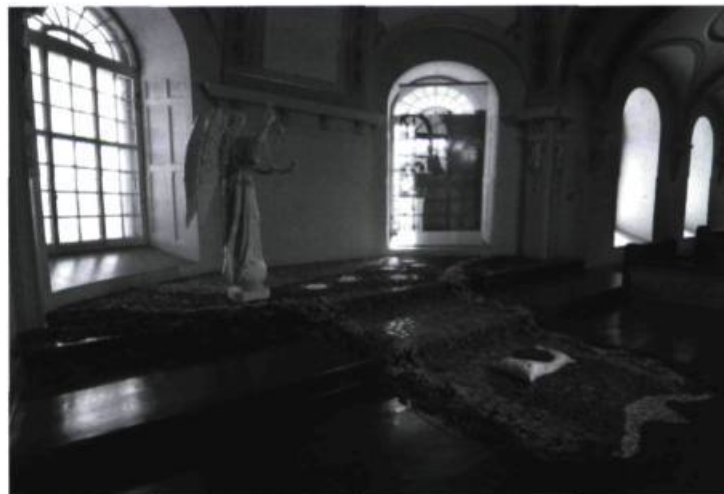
> Thérèse Chabot, Le peseur d'âmes et le dur désir de durer , Le lin : chroniques et récits , 2007. Photo : Michel Dubreuil.

La région de Portneuf regorge de beauté et de trésors cachés, comme cette biennale qui gagne à être connue et qui rassemble des artistes de calibre international. Il s'agit d'un événement à découvrir. La prochaine édition aura lieu en 2009. ■ www.biennaledulin.ca