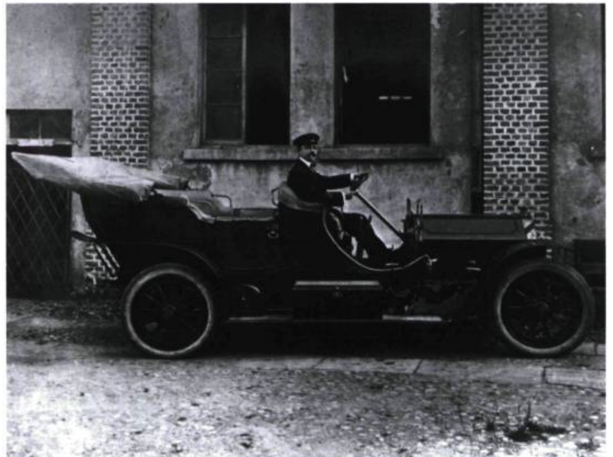
> Marinetti, 1915.

> Marinetti salua la Première Guerre mondiale comme « le plus beau poème futuriste » et la célébra avec son poème « en mots libres » Sintesi futurista della guerra , en 1914.