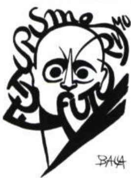
> Portraits de Marinetti par Giacomo Balla.