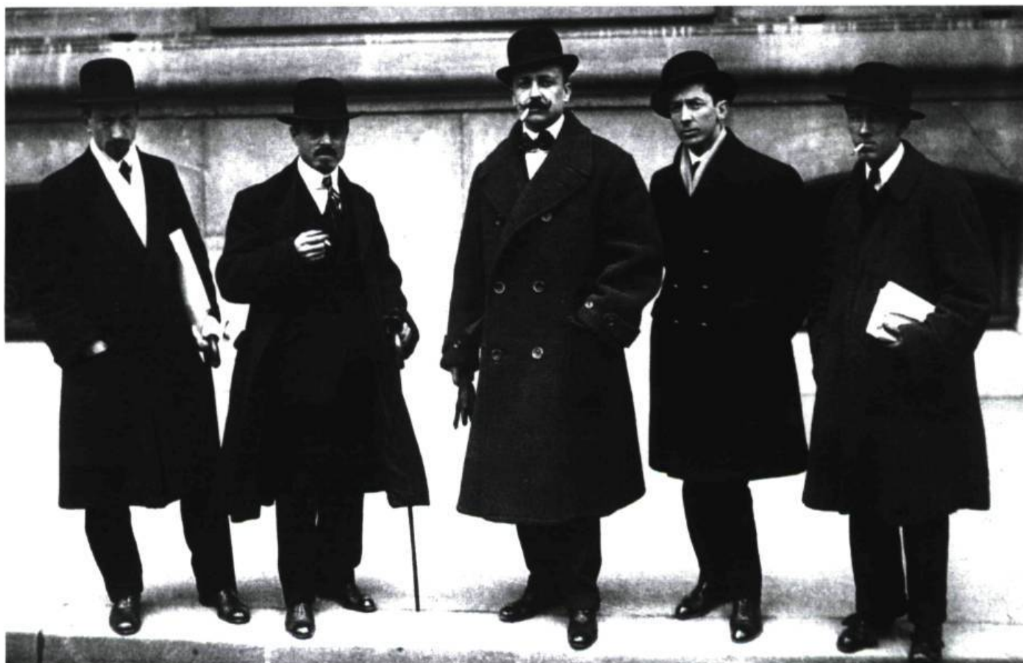
> De gauche à droite : Luigi Russolo, Carlo Carrà, Filippo Tommaso Marinetti, Umberto Boccioni et Gino Severini.